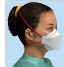
Atemschutzmaske mit Ventil